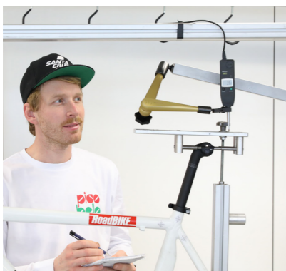
Auf den RB-Prüfständen wurden alle Carbon-Sattelstützen einheitlich getestet.

FAZIT: Komfort- und Gewichtstuning muss nicht teuer sein – schon eine mittelpreisige Carbon-Stütze macht den Renner spürbar komfortabler und leichter. Spielt Geld keine Rolle, kann eine High-End-Stütze als ultimatives Upgrade in beiden Disziplinen noch etwas mehr herausholen.